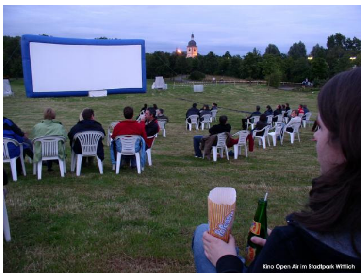
Kino Open Air im Stadtpark Wittlich

Kaarten te koop bij de toeristeninformatie voor 5,= in de voorverkoop vanaf begin juli: Neustrasse 18 in Wittlich of 's avonds voor 6,= aan de kassa.